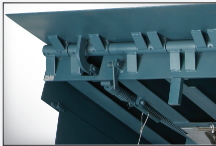
El reborde tiene una extensión confiable por medio de un exclusivo mecanismo de enganche de reborde y es completamente flexible si un remolque lo impacta en el retroceso.