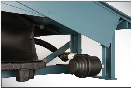
El motor del ventilador de baja presión de 115 V monofásico proporciona un suministro de aire de gran volumen para accionar y posicionar el nivelador de manera confiable.