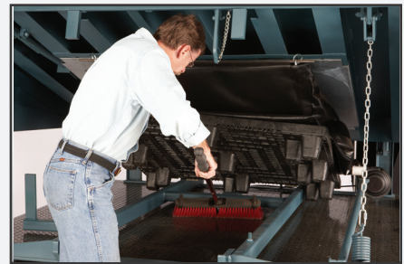
Bastidor del nivelador fácil de limpiar que permite una limpieza sin esfuerzo del suelo del pozo.