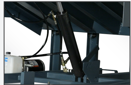
Los cilindros de puerto doble permiten que el líquido hidráulico se desplace en ambas direcciones en un sistema regenerativo.