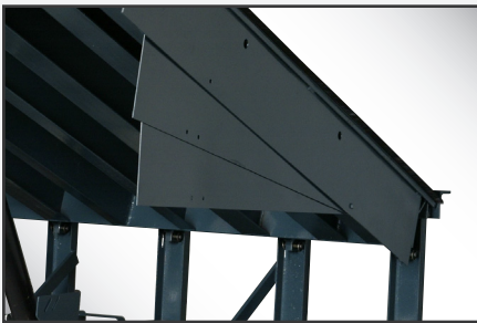
Guardapiés de estilo deslizante de alcance completo para una mayor seguridad.