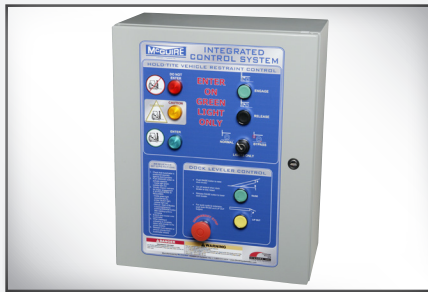
Panel de control integrado opcional para el nivelador, el retenedor y la cortina.